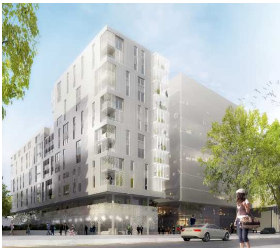
Vue depuis l'avenue de France

6 300 m 2 DE LOGEMENTS, COMMERCES ET BUREAUX SUR L'AVENUE DE FRANCE EN FACE DE LA BIBLIOTHEQUE NATIONALE DE FRANCE