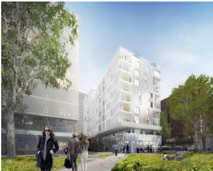
Vue depuis la promenade plantée au Sud